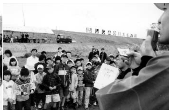
▲ イベント会場となった中州。お楽しみ抽選会やジャンケン大会などで一喜一憂