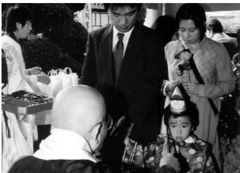
▲ 健やかに育つように、おはらいを受けました