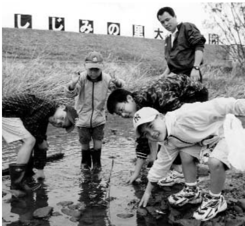
▼ 「あっ、見つけた」としじみをたくさん採って満足気な表情を浮かべていました