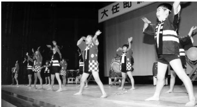
▲ 大任小児童（左）と今回芸能発表初参加となった、なのはな保育所園児がソーラン節を元気よく披露