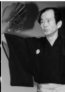
▲ カラオケや民謡、仕舞などが行われた芸能発表。大勢の観客をわかせていました

11月3日、4日の両日、レイ ンポーホールとB&G体育館で 総合文化祭が開催されました。 今年で27回目を向かえた総合 文化祭。歌や演奏、踊りなどを 芸能発表で、また書や絵画、パ ッチワークなどを作品展示で、 日ごろからの練習の集大成を発 表しました。会場に訪れた人た ちは、芸術の秋を満喫しました。 3日には、レインポーホール で芸能発表が行われ、会場には 多くの人が訪れ、立ち見する人 が出るほどに。大勢の観客を前 に舞踊やコーラス、詩吟、太鼓 など、多種多様な56演目を発表 練習に練習を重ねた成果を披露 し、喝采を浴びていました。 作品展示は3日と4日の2日 間開催。会場となったB&G体 育館には、陶芸や書道、手芸品 などバラエティに富んだ作品が たくさん展示されました。鑑賞 に訪れた人たちの目を惹きませ 作品を前に盛んな意見交換が行 われていました。