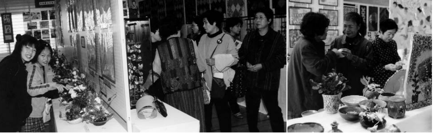
▲ 「うまいごと、できてるね～」作品を前にして話に花を咲かせていました