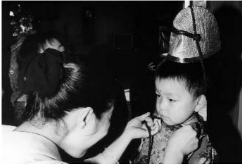
▲ 烏帽子をかぶると、かわいい稚児の完成です