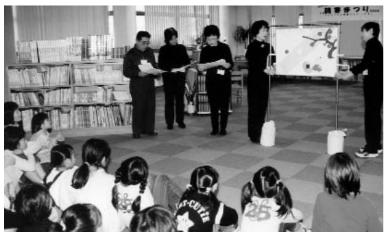
◀ 参加した人たちは、おはなしの世界にとっぷりと浸っていました