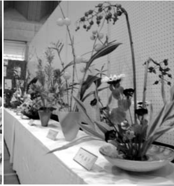
▲ 陶芸、木目込み人形、生け花…。ズラリと並んだ力作、傑作が勢ぞろい