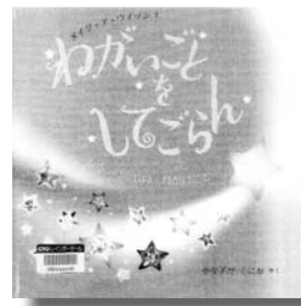
わがごとしどろ ティファニー・リーストン他 やなぎたくにお 訳作

人間はなぜ笑うのでしょうか？ 笑うのは人間だけでしょうか？ 計り知れない、笑いの力…。「日本笑い学会」会長が、哲学的、社会的、科学的視点から「笑い」を真面目に研究します。