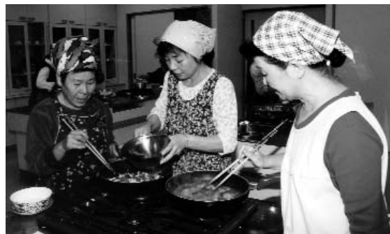
▲ 調理室いっぱい食欲をそそる香りが漂っていました