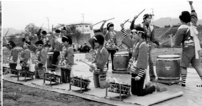
▲ 今任小の音楽クラブが見事なパチさばきを披露