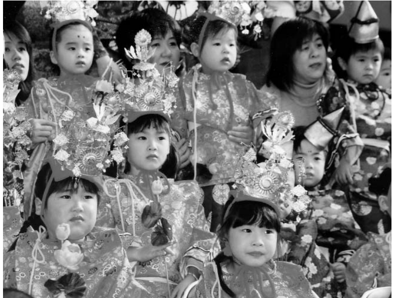
◀ きれいな装束とお化粧で、ちよつぷりおさまし