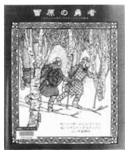
雪原の勇者 リーサー・ルンガーラセン メアリー・アゼアリン 千葉茂樹 訳 絵作