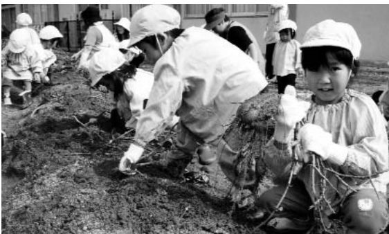
▲ 「見て見て、こんなに大きなイモが取れたよ」とニコニコ