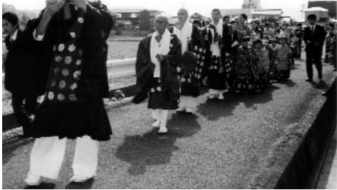
▲ 行列は50メートル以上にもなりました