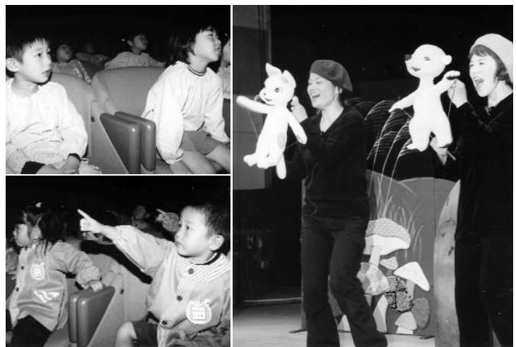
▲ 人形たちの一つ一つの動きに大きな反応を見せていました

音楽や演劇など生の芸術文化に触れ、豊かな感性を育んでもらいたいと年に4回催されているレインボーホールの自主事業。今後も、町民皆さんが楽しめるような事業を行っていきたいと考えています。