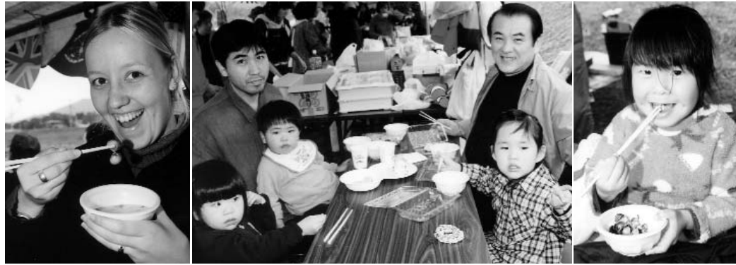
▲ 見てください、この笑顔。しじみ汁で訪れた人たちの心も体もポッカポカです

「天気予報を見たら、雨マークになっちゃったとき、心配しよったんですよ。でも雨が降らなくて、本当に良かったね」と訪れた人たちの声。数日前から不安定な天候が続く、中止が心配された10月31日、彦山川の六本松河川敷で、商工会主催の『第18回しじみ祭り』が開催されました。この日は、秋晴れとは言えないまでも、まずまずのお祭り日和。町内外から多くの人が訪れ、秋のお祭りを楽しみました。 また、この日は年に一度しじみ採りが解禁になる日。バケツやビニール袋を持った人たちが川の中で、しじみ採りに夢中になっていました。河川敷には、しじみ汁をはじめ、おでんや焼きそばなどの出店が並び、訪れた人たちを楽しませていました。 イベント会場となった中州では、ジャンケン大会や〇×式のクイズ、綱引きなどが催され、豪華賞品をめぐって歓声があがり、盛り上がっていました。