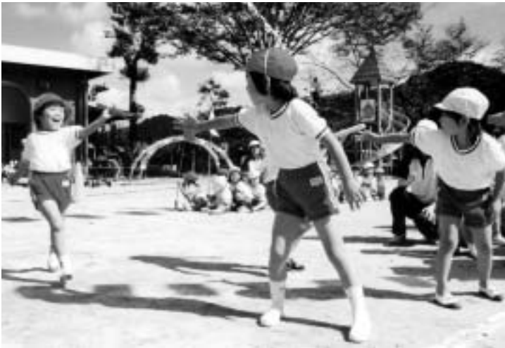
▲ 前日の雨がウソのような快晴の中、運動会を楽しみました

雨が降っても元気いっぱい 50回目を迎えた運動会は2日間開催 どんぐり保育園で10月2日、今年で50回目を迎えた運動会が開催され、園児たち64人がこの日のために練習した成果を披露しました。 しかし、プログラムが半ばに進んだころ、突然の雨が…。残りの競技は翌日に持ち越されました。二日目は、絶好の運動会日和。秋晴れの中、園児たちは、かけっこや障害物競走などの競技で、一生懸命がんばりました。 応援席もたくさんの人でにぎわい、園児たちに盛んな声援を送っていました。また、保護者たちもリレーなどの競技に参加して、園児たちと楽しいひとときを過ごしました。