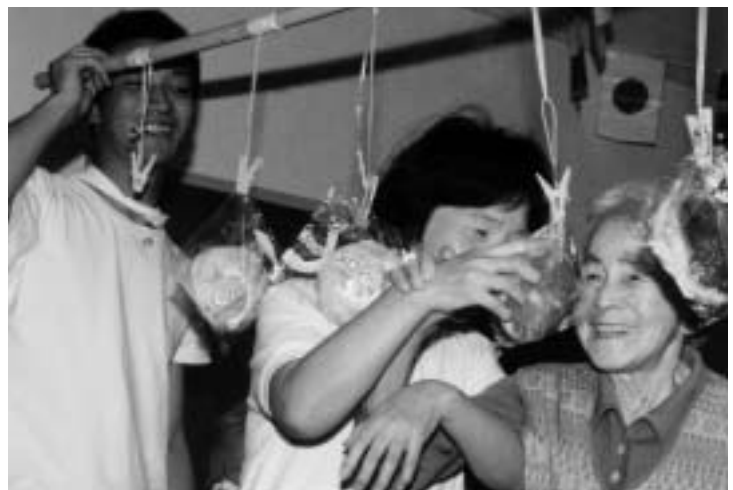
▲ 「おばあちゃん、がんばって」と声援を送られながら頑張りました

「こんなに体を動かしたのは久しぶり。いい運動になったネ。本当に楽しい1日でした」と語ってくれたおばあちゃん。その顔はイキイキとして、ひと回りもふた回りも若返っているように見えました。