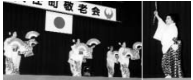
▲ 多彩な余興に、笑い声や拍手が飛び交っていました