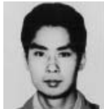
たかはし かつや 高橋 克也 地下鉄サリン事件 身長173cmくらい、中肉