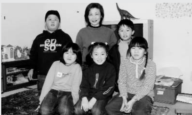
▲ 今任小学童クラブ

ては110番通報してもらおう、というところをお願いするものであり、それ以上の負担を求めるものではありません。