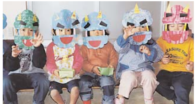
▲ みんな、ちゃんと鬼退治ができたかな？

いじめっこ鬼や泣き虫鬼、おこりんぼ鬼、好き嫌い鬼など自分たちの心の中にいる鬼たちも追い払って、いい子になったかな？