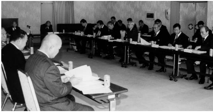
勉強会では合併についての様々な事項を協議しています。(2月10日に行われた会議の様子)

現在、勉強会では各分野にわたって協議が行われています。今回は、勉強会の協議内容をお知らせします。