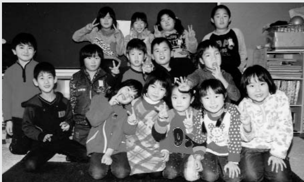
▲ 大任小学童クラブ