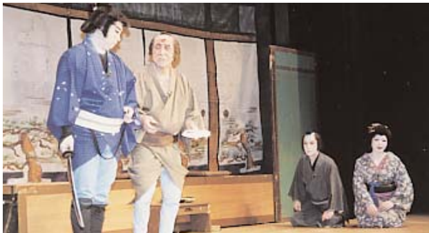
▲ 人情芝居のクライマックス

第一部では、華やかな歌と踊りのシーン、第二部では時代人情芝居を披露しました。人情芝居では、時に笑わせ、最後にホロリと泣かせる熱演で、会場に訪れた300人の観客を大いに魅了しました。