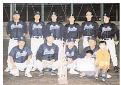
▲ 優勝したギャンブラー。

9月15日と24日、町民野球場で丹村杯争奪軟式野球大会が開催され、天狗屋、ヤンクス、プレイボーイ、アポロース、ギャンブラー、デストロイヤーの6チームが参加。トーナメント戦を争いました。決勝戦に「マを進めたのは、ギャンブラーとデストロイヤー。接戦の末、4対3でギャンブラーが勝利。喜びの初優勝となりました。