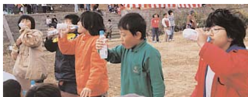
▲ なかなか減らないラムネの早飲み