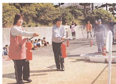
▲ 消火器を使って消火訓練も行いました

「火事です。早く避難してねええ」と放送が園内に流れると、保育士さんに誘導されながら園児たちは無事避難しました。その後、田川地区消防署川崎分署の人たちから火事の怖さを学びました。