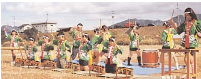
▲ オープニングは、令任小学校音楽クラブの児童たちによる威勢のいい令任太鼓