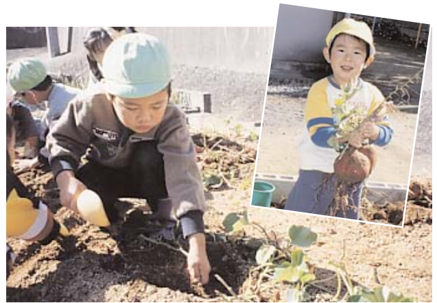
▲ おなか どんなイモがでてくるかな？

収穫された約60キロのイモは早速、焼きイモやスイートポテトなどのおやつにされ、園児たちは満足そうな表情で、収穫の味を堪能していました。