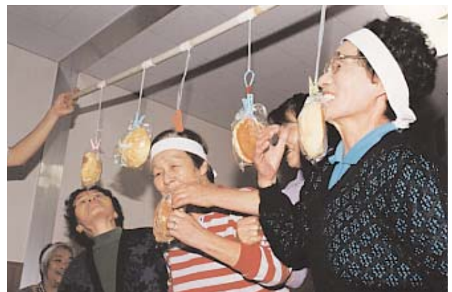
▲ 童心に返ったように楽しんでいました

「こんなに体を動かしたのは久しぶり。あー、楽しかった」とイキイキとした表情でおばあちゃんが話していました。