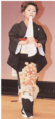
◀ 艶やかな舞を披露

11月3日、4日の西日、レインボーホールとB&G体育館で総合文化祭が開催されました。今年で25回目を向かえた総合文化祭では、歌や演奏、踊りなどを芸能発表で、また書や絵画、手芸品などを作品展示で、一年間の集大成を発表しました。 3日には、レインボーホールで芸能発表が行われ、300人以上の観客を前に、舞踊やコーラス、詩吟、太鼓など、練習に練習を重ねた成果を披露し、喝采を浴びていました。 作品展の会場となったB&G体育館には、絵画や書道、パッチワークなどバラエティに富んだ作品がたくさん展示され、鑑賞に訪れた人たちの目を楽しませていました。