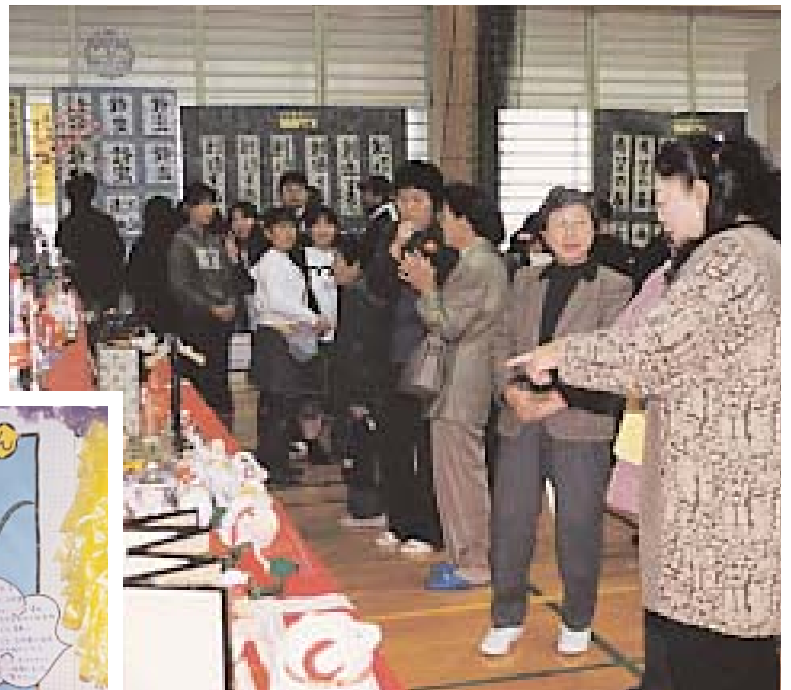
◀ ▲ 保育園児から高齢者までの力作が勢ぞろい。訪れた人たちの目を楽しませていました