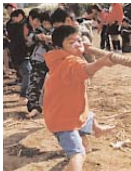
▲ それ、気合いで引つ張れー。盛り上がった綱引き大会