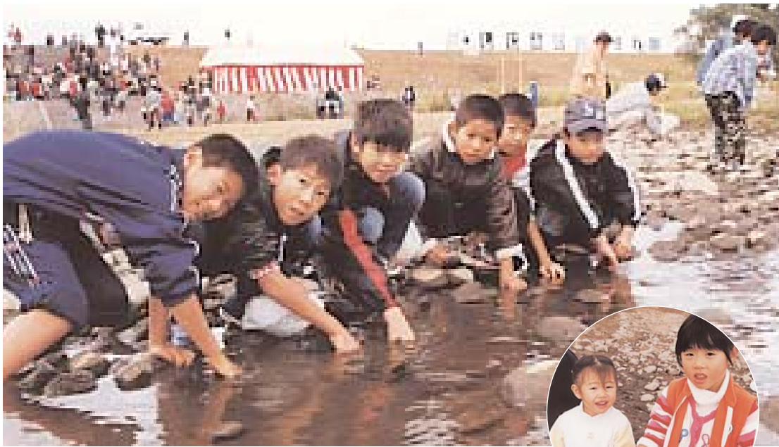
▲ しじみはたくさん採れたかな？