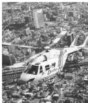
大任町内のドクターヘリの離着陸場所は次のとおりです。

病状が著しく重い患者が発生したとき、救急現場に迅速に医師を送り込み、いち早く救命医療を行うため、九州で初めてとなるドクターヘリが福岡県により久留米大病院高度救命救急センターに配備されました。