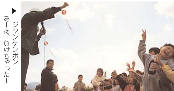
▲ ジャンケンポン！ あーあ、負けちゃったー