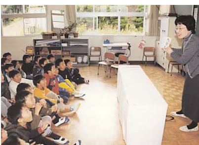
▲ 読み聞かせに夢中の子どもたち

布の絵本や英語での読み聞かせの以外にも、エプロンシアターなどがあり、子どもたちが興味をよせ、真剣な眼差しで聞き入っている姿がとても印象的でした。