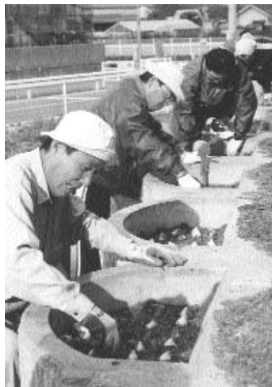
▲ ご協力ありがとうございました

町民のみなさんと一緒に『花いっぱいのまち』を作っていること、11月10日、レインボーホールと建徳寺古墳公園下の駐車場で、チューリップの球根植えが行われました。