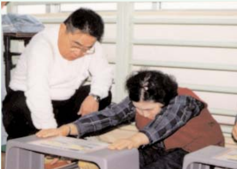
▲ 前屈測定では、ひざを曲げないように…。測定員の目が光ります

また、体脂肪測定や骨密度の測定を行い、体脂肪の測定結果を見て一喜一憂する人も。最近、運動不足が気になる私も挑戦。体脂肪を測ると約14パーセント。「おっ結構低い」と思ったまでは良かったのですが、前屈を測定すると、体が全然曲がらない。翌日は全身が筋肉痛になってしまいました。