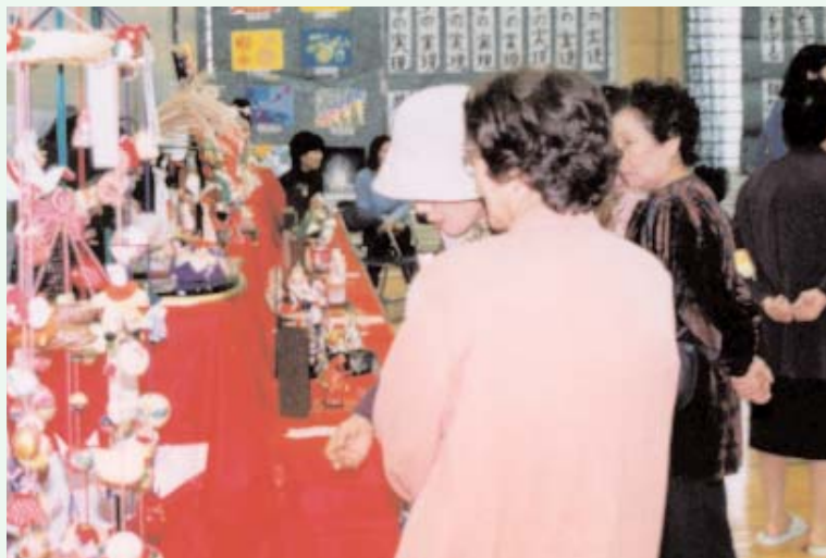
▶ 作品の前に会話が弾んでいました