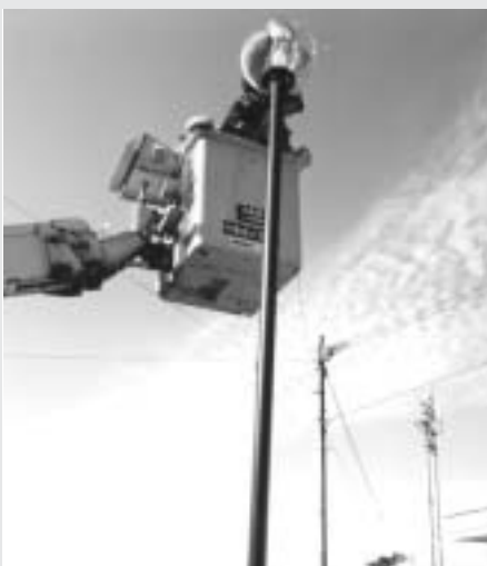
▲ クレーン車も登場し、大活躍でした

田川電気工事業共同組合（組合員三十三人）では、田川市郡にある公共施設の電気設備の清掃作業や修理作業をボランティアで行っています。十一月九日、本町のレインボーホールと総合運動公園内のゴミ拾いと外灯の清掃を行いました。寒い中、ボランティアの人たちが熱心に作業してくれたおかげで、とてもきれいになりました。