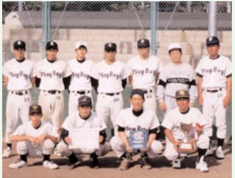
▲ 優勝したプレイボーイ。喜びいっぱいです

秋晴れに恵まれた10月7日、町民野球場と中学校グラウンドで第1回田中杯争奪軟式野球大会が開催され、田中アポローズ、アスレックス、プレイボーイ、ギャンプラー、ヤンクスの5チームでトーナメント戦を争いました。結果は1回戦、プレイボーイ対アスレックス＝7対0、ヤンクス対田中アポローズ＝4対3、準決勝、プレイボーイ対ギャンプラー＝7対1、決勝戦、プレイボーイ対ヤンクス＝14対2で、プレイボーイが初代優勝チームの栄冠を手にしました。