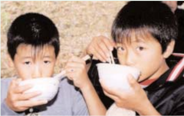
▲ 大任名物しじみ汁に舌つつみ

十月二十八日、彦山川の六本松河川敷で、商工会青年部・女性部主催の『第十五回しじみ祭り』が開催されました。前日からの不安定な天候で、当日は朝からポツポツと小雨模様だったのですが、この日は年に一度しじみ採りが解禁になる日。川の中はバケツを持った人たちがビニール袋いっぱいにしじみを採って満足顔でした。 また河川敷では、しじみ汁をはじめ、ポン菓子やヤキソバ、綿菓子などの出店が並んで、訪れた人々を楽しませていました。中州では、ジャンケン大会や○×式のクイズ大会、ラムネ早飲み大会などが催され、豪華賞品をめぐる歓声があがり、盛り上がりがありました。