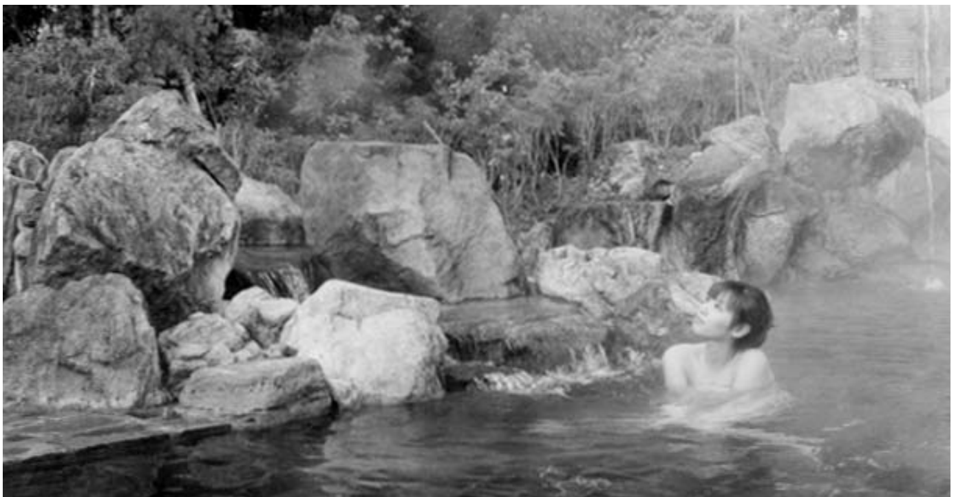
▲ おだやかで、静かな時の流れが心と体をリラックスさせてくれます