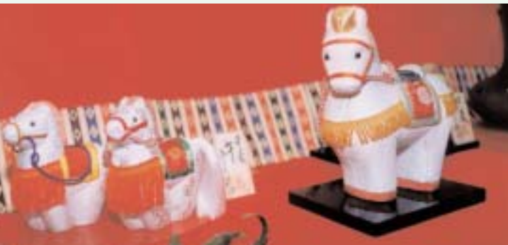
▼ 来年の干支、午（うま）も木目込み人形に…