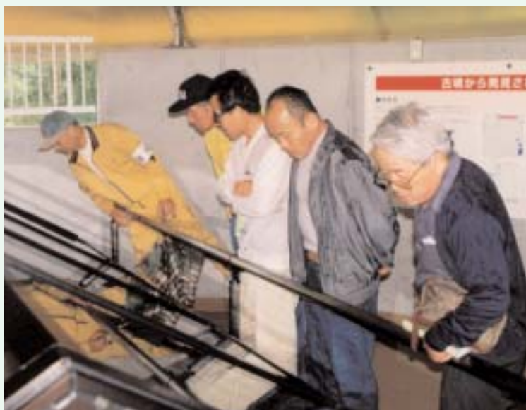
▲ 見学者は古代のロマンに魅了されていました

建徳寺古墳説明会に九十人見学 —遠賀川流域で古墳を同時公開— 「古墳の中がとてもわかりやすく復元されているし、展示品もたくさんあって、まるで古代にタイムスリップしたみたい」見学を終えた人が感想を話してくれました。 十月二十日、二十一日、遠賀川流域の古墳同時公開と銘打って、桂川町の王塚古墳をはじめ若宮、飯塚、穂波直方、田川、大任の七か所で、同時に現地説明会が行われました。町の建徳寺古墳では、一日目は五十人、二日目は悪天候にも関わらず、四十人の人が訪れました。 見学に訪れた人たちは復元された石室の内部や発掘された品々（刀剣やイヤリングなど）を興味深く見学し、古墳についての知識を深めました。 また、見学者からの質問には、ボランティアの人たちに協力してくれ、熱心に説明していました。