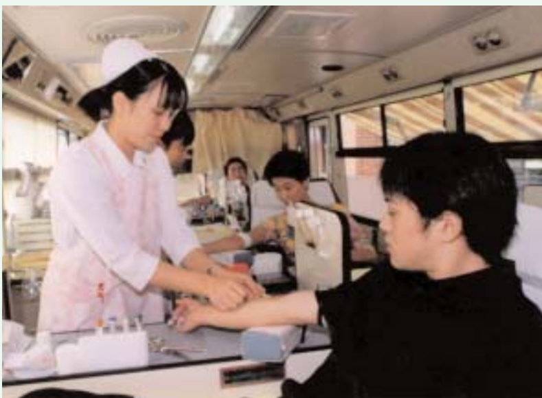
▲ みなさんの善意が命を支えています

九月二十一日、役場で献血が行われ、四十一人の協力で十五・六リットルの血液が集まりました。ありがとうございました。献血は、輸血を必要とする人に「思いやり」を送るボランティア。これからも、みなさんご協力をお願いします。