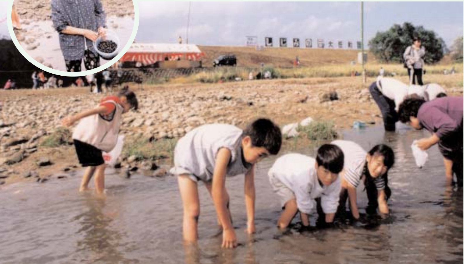
▲ 会場に来た人は、腕や裾をまくってザブザブ川に入り、たくさんのしじみを探っていました