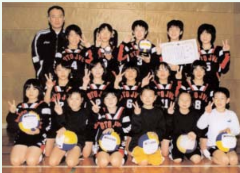
▲ みんな笑顔でVサイン

なお、大任ジュニアバレーボールクラブでは、メンバーを募集しています。毎週火曜日は19時30分、木曜日は17時30分、土曜日は15時からB&G体育館で練習をしています。一度見学に来てみませんか。