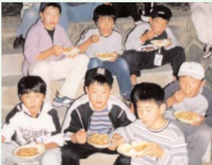
▲ 自分で作ったカレーはおいしい？