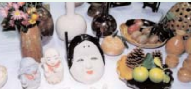
▲ 陶芸も個性的な作品がたくさん