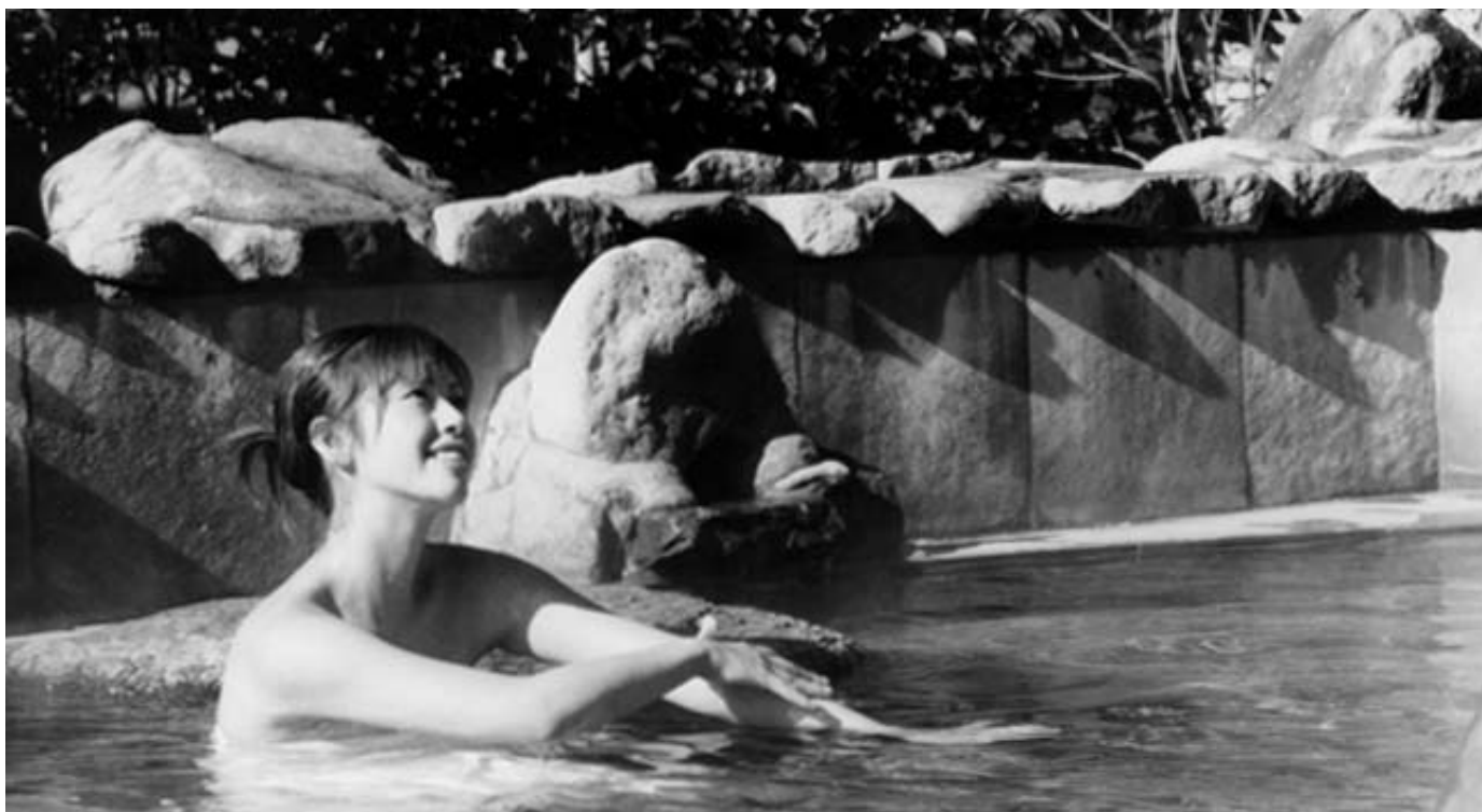
▲ 英彦山の大自然に囲まれた露天風呂では、四季の風景を楽しむことができます