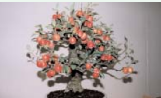
◀ 『実りの秋』が見事に表現されていました