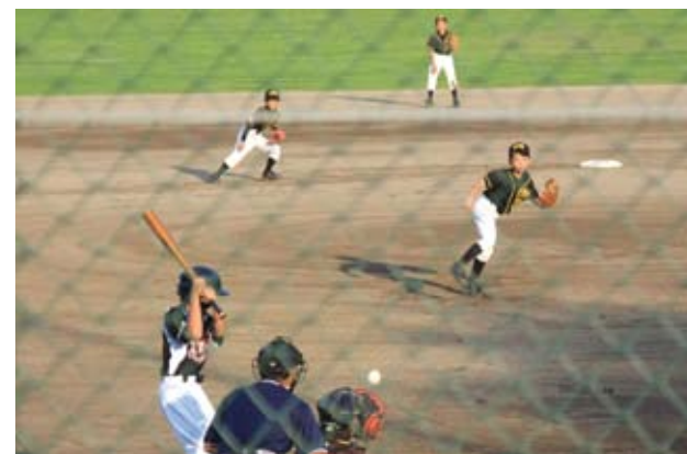
▲決勝戦ではバッテリーを中心にしっかりと守り抜き、完封勝利

県大会は8月23日～25日までの3日間、雁ノ巣球場(福岡市東区) ほかで行われます。