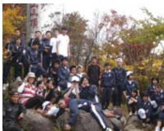
▲ 昨年の英彦山登山