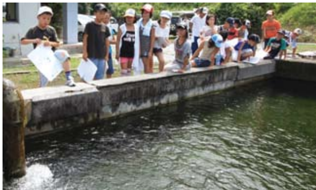
▲ろ過池の底には砂が敷き詰められ、水を浄化します

浄水場では水道課職員から「水はどこから来るのか」「安全な水、使用できる水になるまでの工程はどうなっているのか」などを学びました。その後児童たちは、水がたまっているろ過池を見てまわり「ろ過池の砂はどこから持ってくるの」などと質問をしていました。