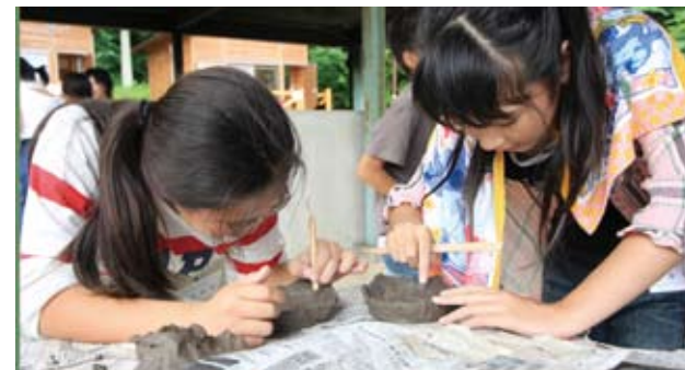
▲どんな焼き物を作っているのかな？ できあがりを楽しみ

そのほかにも、夜は人権学習や肝試し、2日目にはグラウンドゴルフなどを行い、充実した2日間を過ごしていました。