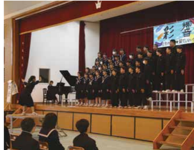
▲最上級生として気持ちのこもった合唱を披露する3年生

また、生徒が作成した様々な作品の展示発表や、吹奏楽部3年生にとって中学校で最後となるステージ発表、生徒自由発表、生徒会ステージ発表なども行われました。