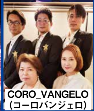
CORO_VANGELO (コーロバンジェロ)

■とき 12月24日(日) 第1部 11時~(予定) 第2部 13時30分~(予定)