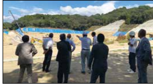
▲最終処分場の視察の様子