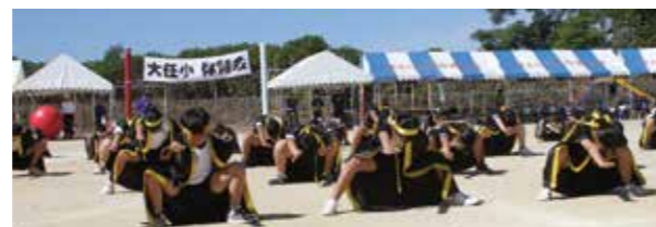
▲体育会でのソーラン節

10月22日、4年ぶりに全校児童が一斉に参加しての体育会を行いました。当日は、澄み切った秋晴れの空のもと、たくさんの方々の保護者や地域の方々の応援をバックに、子どもたちは開会の入場行進から閉会行事までの全ての種目へ一生懸命に取り組むことができました。子どもたちの気合いに満ちた真剣な顔と満面の笑顔がとても素敵でした。子どもたちは体育会を通して、充実感・達成感を味わい、さらに成長することができたことと思います。