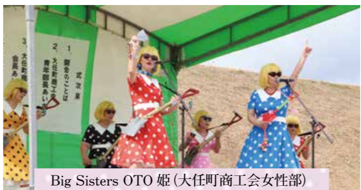
Big Sisters OTO 姫 (大任町商工会女性部)

特設ステージ前では、今任小学校の児童による今任太鼓や大任中学校吹奏楽部が生演奏を披露。また、豪華景品獲得のチャンスである、ラムネの早飲み大会や大縄跳び大会、抽選会などのイベントにも多くの人が参加し、秋の祭りを存分に満喫していました。