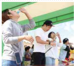
ラムネの早飲み大会