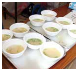
大任町商工会 しじみ汁