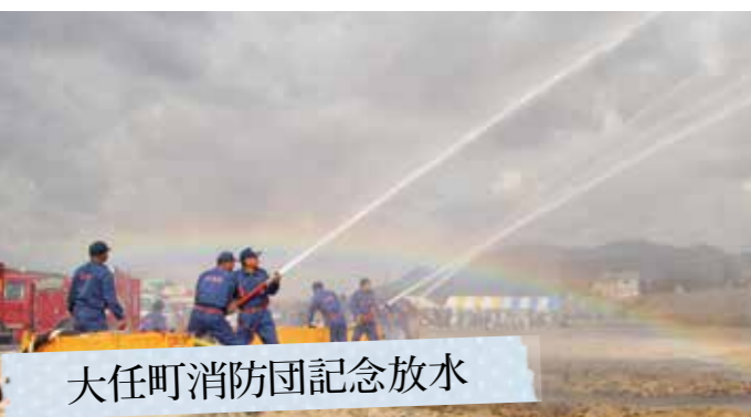
大任町消防団記念放水