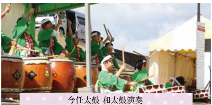
今任太鼓 和太鼓演奏