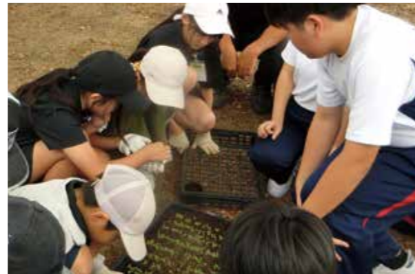
▲花いっぱい運動で小・中学生が交流する様子

10月3日、大任中学校で花いっぱい運動があり、大任小学校の4年生が参加し、今任小学校の4年生や大任中学校の生徒とともに、ポットに土や苗の移植活動を行いました。子どもたちは楽しみながらも一生懸命活動することができました。