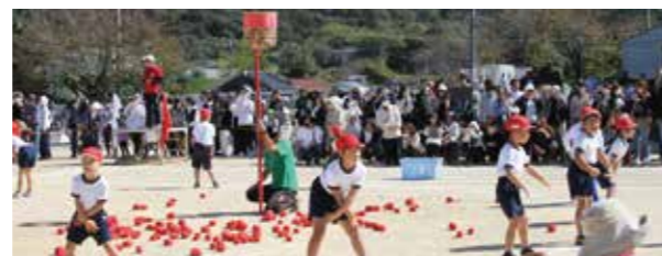
▲体育会でのチェコリ玉入れ