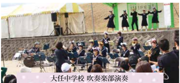
大任中学校 吹奏楽部演奏