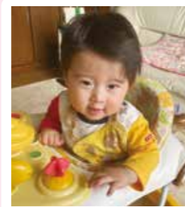
出水 新女くん 1歳 令和4年6月30日生まれ 富士見ヶ丘・男の子