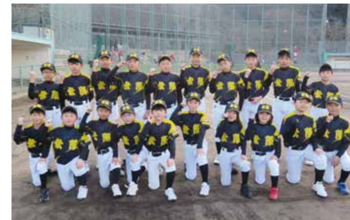
▲次の大会でも持ち前のチームワークで好成績を期待しています