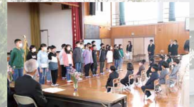
▲6年生から歓迎の言葉と校歌の紹介がありました