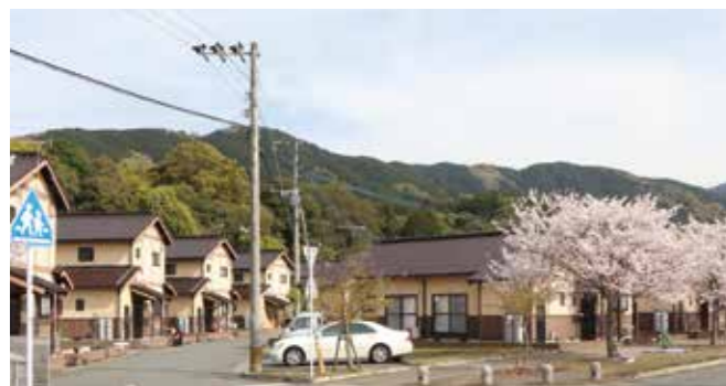
▲上写真が撮影されたと思われる場所の現在の様子