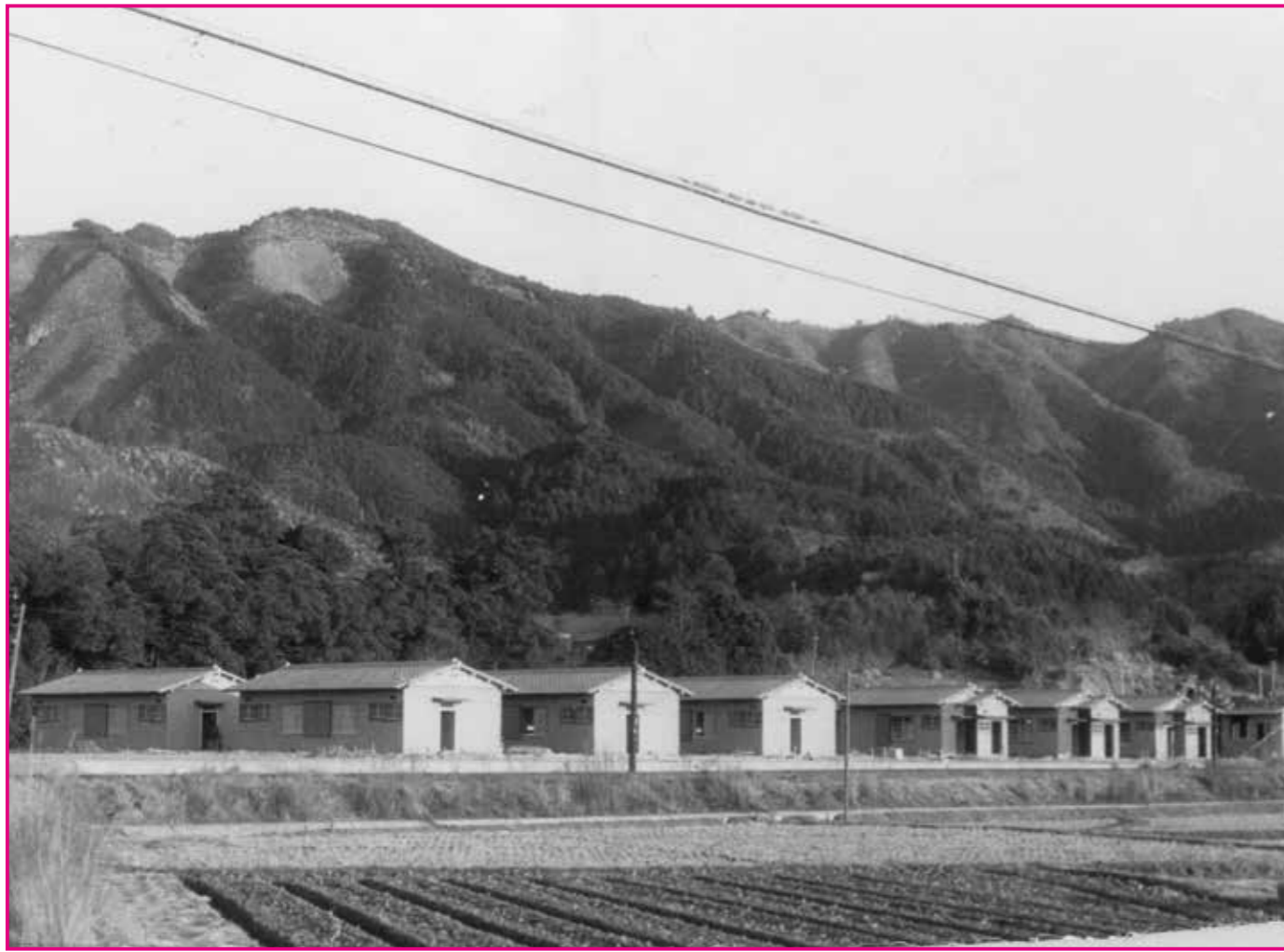
上写真：昭和45年頃に撮影された成光町住付近の写真です。