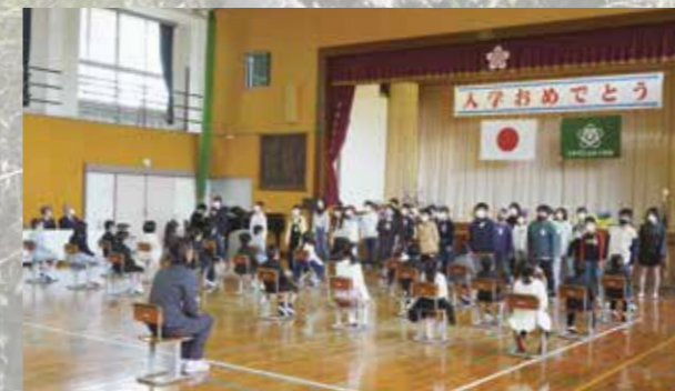
▲6年生から歓迎の言葉と校歌の紹介がありました