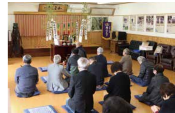
▲厳かな雰囲気の中で行われました

このような未曾有の大災害を風化させないために、現在でも檀家のご先祖供養とともに、続けられています。