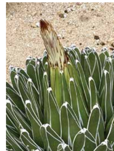
▲4月4日の様子。花茎が成長を開始