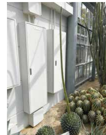
▲4月12日の様子。約170cmまで成長