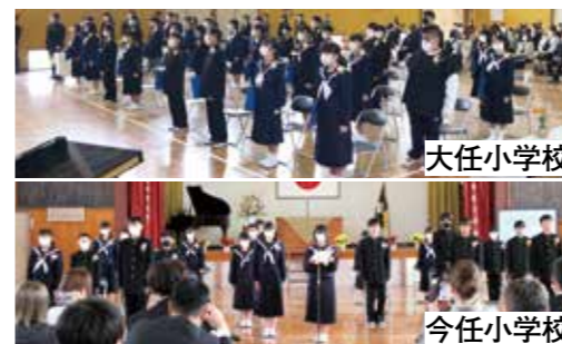
▼まだ、少し大きい中学校の制服が印象的でした

3月17日、大任小学校と今任小学校の卒業証書授与式が行われました。大任小学校30人、今任小学校20人の児童が卒業を迎えました。先生、友達、下級生との記憶を1コマ1コマ振り返り、小学校との別れを実感。保護者と恩師が見守る中、児童たちは6年間の思い出が残る校舎に別れを告げ、輝く新たな一歩を踏み出しました。