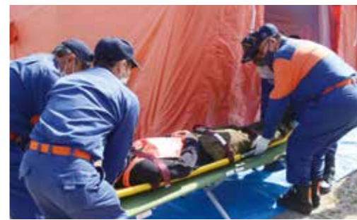
▼意識がない人を担架で搬送の様子

3月11日、川崎町立真崎小学校で、地元住民と関係団体による3.11避難誘導訓練が行われました。この訓練は、平成23年3月11日に発生し、多大な被害をもたらした「東日本大震災」の教訓をいつまでも忘れることなく、災害が発生した場合の自助・共助による地域防災力の強化や地域住民の防災意識の普及を目的に実施されました。