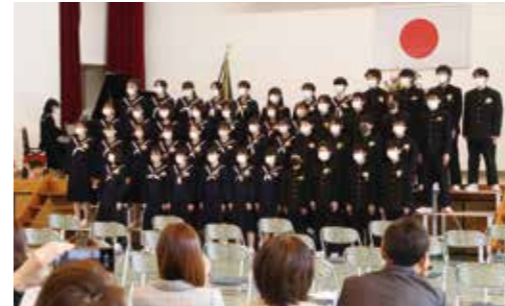
▼3年間の想いを歌にのせ合唱しました

3月9日、大任中学校卒業証書授与式が行われ、48名の生徒が思い出の詰まった校舎に別れを告げました。式では、奥校長先生による式辞や卒業生からの答辞が述べられ、卒業生たちは思い出を噛みしめながら聞いていました。最後は、先生や保護者に見送られながら、卒業の喜びと中学校生活の思い出を胸に巣立っていきました。