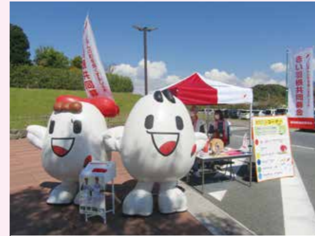
▲道の駅での募金活動の様子