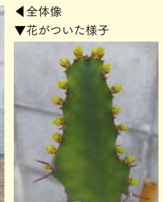
◀全体像 ▼花がついた様子