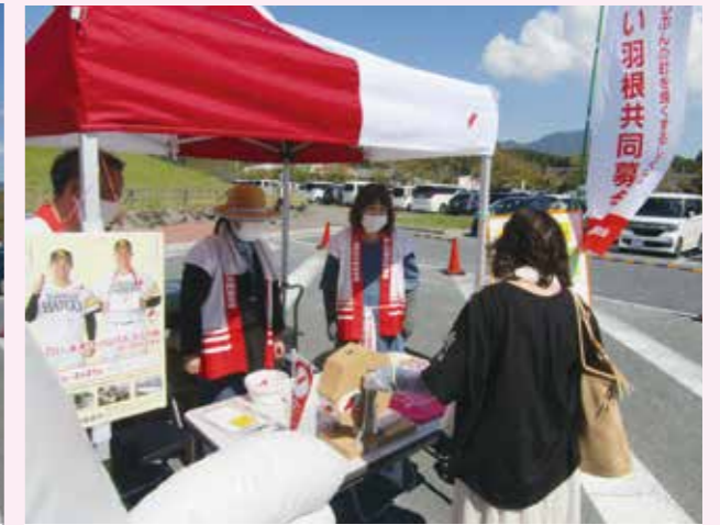
▲道の駅での募金活動の様子

令和4年10月から12月末まで、赤い羽根共同募金運動が行われました。皆さまからのご寄附誠にありがとうございました。