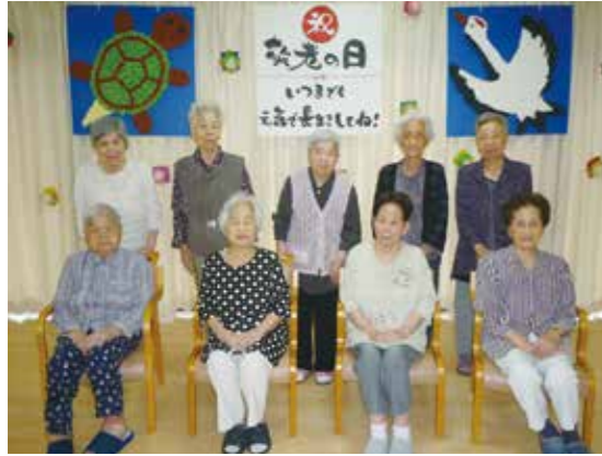
▲余興が大好きな方ばかりで、とても楽しんでいました

敬老会では9名の利用者が参加し、施設長から米寿の方へ表彰状が手渡され、その後スタッフによる歌や踊り、利用者みんなで歌を歌うなど、余興を楽しみました。