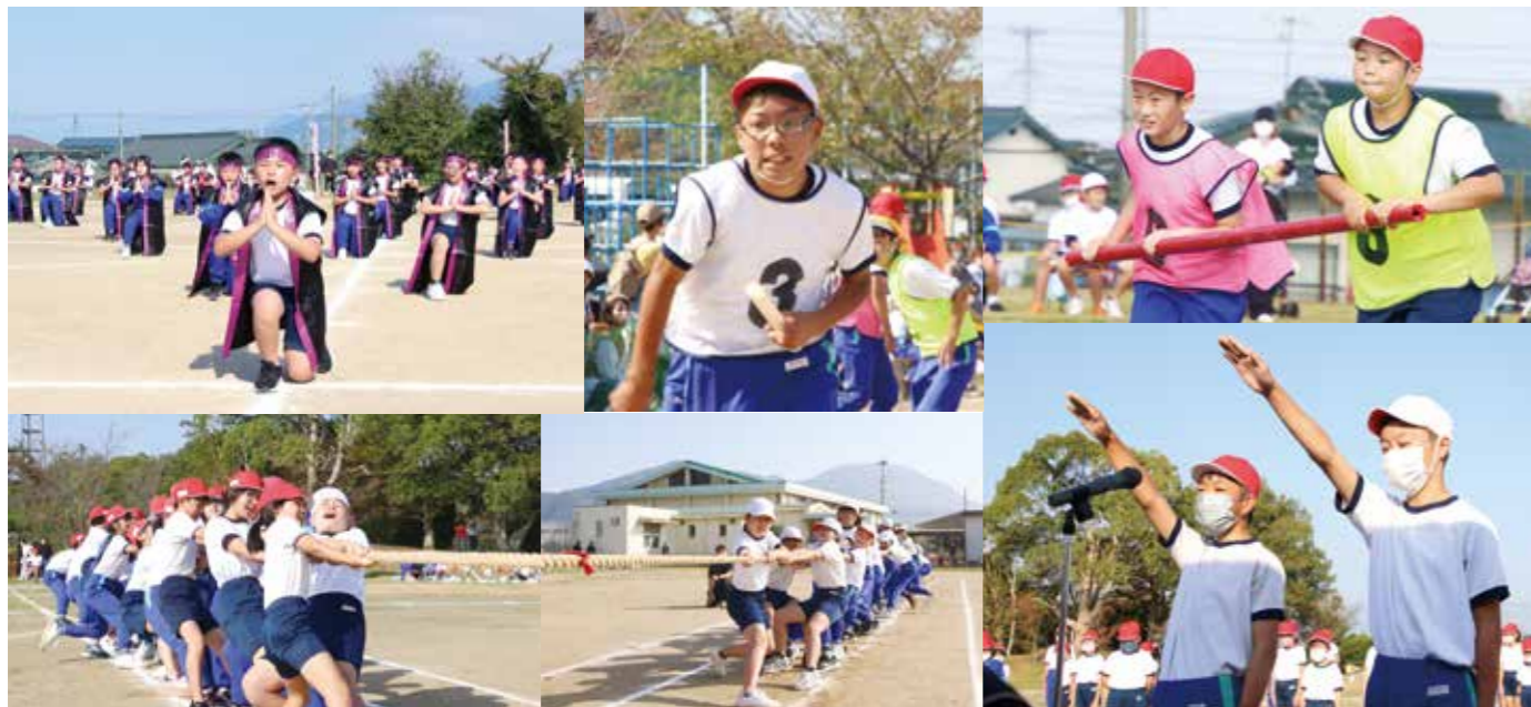
▲ 10月16日に開催された今任小学校 協力スポーツ祭の様子