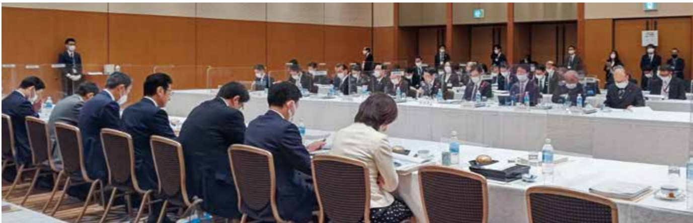
▲懇談会の様子。写真手前が地元選出国会議員、写真奥が福岡県知事を始めとした県内各団体の代表。

今後も、国や県と、より一層強いパイプを構築し、情報共有を行いながら、全町民の福祉の向上と本町の振興・発展を目指すとともに「住みたい町・住み続けたい町・誰もが住みたくなる町」を実現すべく、実効性のある施策を行ってまいります。