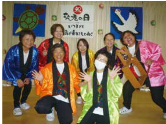
▲スタッフの方が衣装などを手作りして、余興を盛り上げました