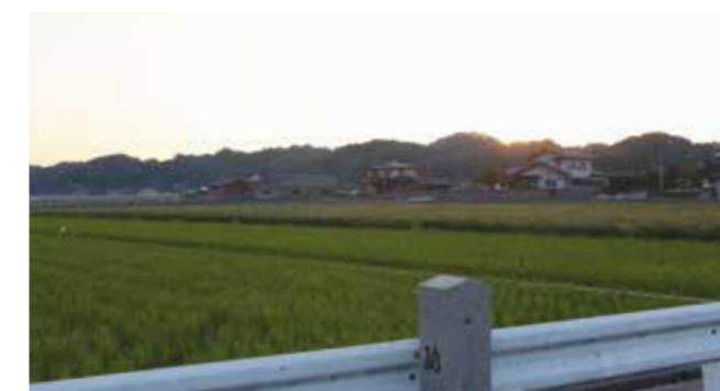
▲上写真が撮影された場所の現在の様子（安高地区）