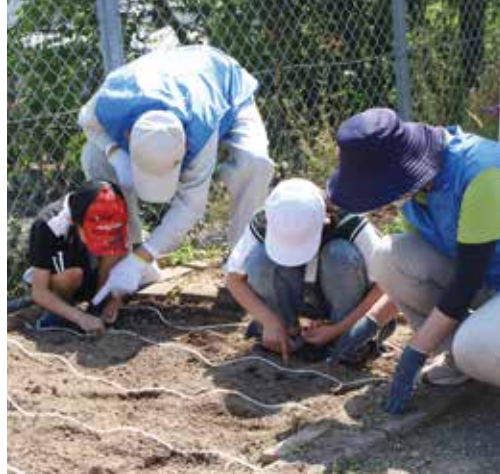
▼人権擁護委員の指導を受けながら種を植えました