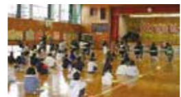
▲ありがとうの会の様子