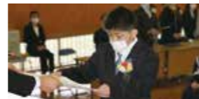
▲卒業証書授与式の様子