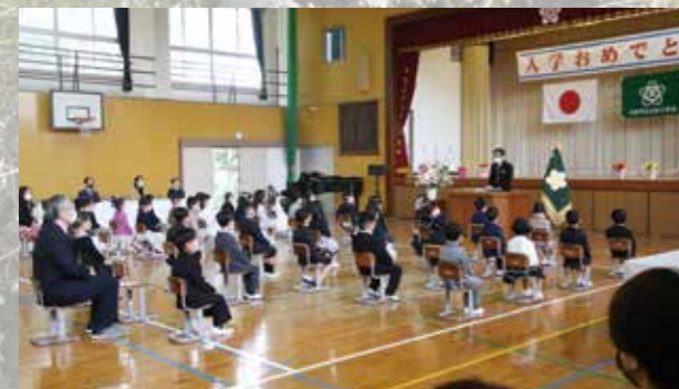
▲校長先生の話真剣に聞く入学生