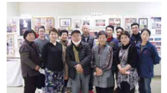
▼作品を展示された有志の方々

3月19日から3月27日まで、大任町公民館1階の会議室で、大任町文化連盟の有志による作品の展示会「有志展」が行われました。