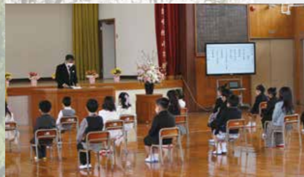
▲校長先生の挨拶に元気な声で答える入学生

期待と不安を胸に、大任中学校で4月8日に、大任小学校・今任小学校で4月11日に入学式が行われました。今年度は大任中学校41人、大任小学校41人、今任小学校16人の新1年生が入学。中学校の入学式では、3年間をともに過ごす制服に袖を通し、緊張した面持ちながらも、少し大人になった中学生の姿が見られました。また、両小学校の入学式では、校長先生があいさつをすると、大きな声で元気よくあいさつを返す新1年生の姿がありました。今年も、新型コロナウイルスの影響により、短時間での開催となりました。式の様子を写真でご紹介します。