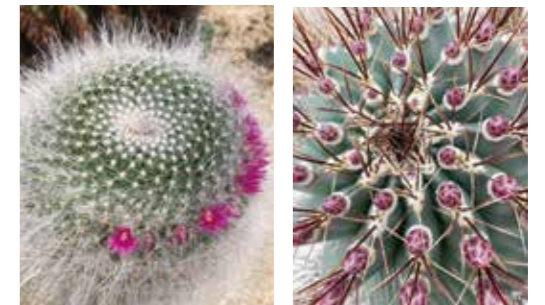
▼左は「玉翁」右は「緋翔丸」の写真です

サボテンがそろそろ春の開花に向けて準備を整えてきています。サボテンの「玉翁」や「緋翔丸」など、開花時期が早いものは、もう花が咲き始めています。他の種類のものもつぼみを付け始めてきています。これから色々なサボテンが開花するまでの様子を観察することが出来ますので、是非サボテンハウスでご覧ください。