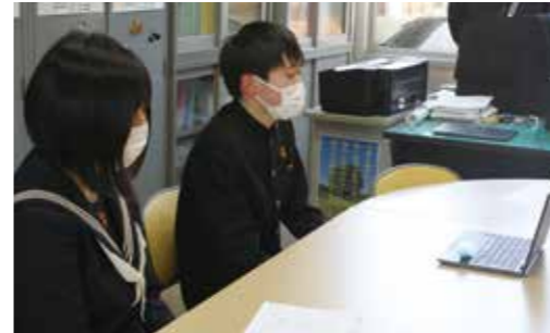
▼タブレットを通じて激励集会を行っている様子

2月28日、大任中学校で「3年生激励集会」が行われました。今回は新型コロナウイルス感染症対策のため、各教室のテレビとタブレットをつなぎ行われました。生徒会長をはじめ1・2年生たちが、3年生に対し激励や感謝の言葉を送りました。最後は、3年生を代表し旧生徒会長から1・2年生に向けて、思い出と感謝を述べ、激励集会は幕を閉じました。