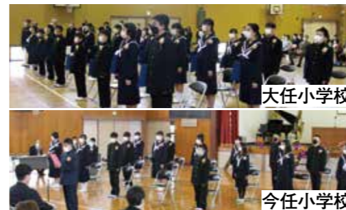
▼まだ、少し大きい中学校の制服が印象的でした

3月18日、大任小学校と今任小学校の卒業証書授与式が行われました。大任小学校27人、今任小学校19人の児童が卒業を迎えました。先生、友達、下級生との記憶を1コマ1コマ振り返り、小学校との別れを実感。保護者と恩師が見守る中、児童たちは6年間の思い出が残る校舎に別れを告げ、輝く新たな一歩を踏み出しました。