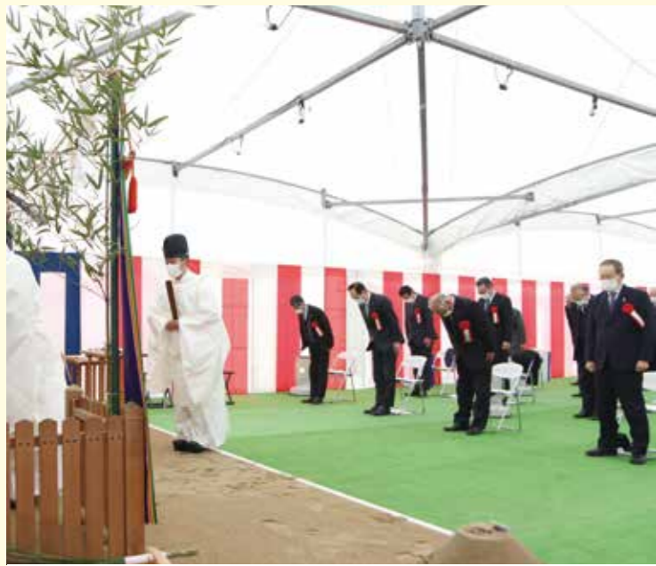
▲ 工事の安全を祈願する出席者の方々