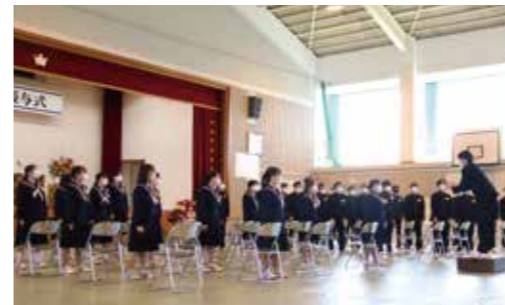
▼3年間の想いを歌にのせ合唱しました

3月10日、大任中学校卒業証書授与式が行われ、46名の生徒が思い出の詰まった校舎に別れを告げました。式では、奥校長先生による式辞や卒業生からの答辞が述べられ、卒業生たちは思い出を噛みしめながら聞いていました。最後は、先生や保護者に見送られながら、卒業の喜びと中学校生活の思い出を胸に巣立っていきました。