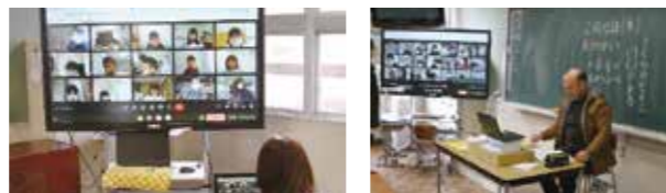
大きな声であいさつをしています! 1年生も元気のよい返事でした