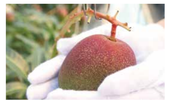
▼現在、子どもの手のひらほどの大きさです

今年もマンゴーの実が成長しています。マンゴーは、多くの花が受粉し約10個の実をつけますが、そこから間引きし、よりよい実を1つだけ残します。マンゴーを道の駅おおとう桜街道に出荷するのは、5月下旬の予定です。甘くておいしい大任産マンゴーをぜひご賞味ください。