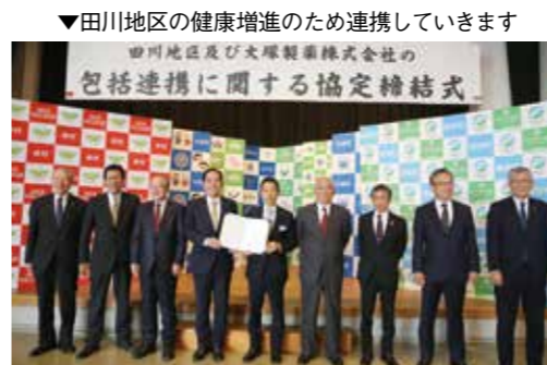
▼田川地区の健康増進のため連携していきます

11月1日、田川市民会館で、田川地区及び大塚製薬株式会社の包括連携に関する協定締結式が開催されました。この協定は、田川地区8市町村と大塚製薬株式会社、それぞれが持つ「人材」「知識」「サービス」などの資源を活用して協力することにより、田川地区における住民の健康づくり及び住民サービスの向上などを目的としています。