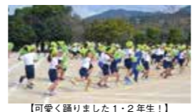
【可愛く踊りました1・2年生!】