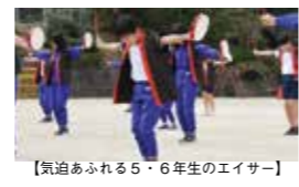
【気迫あふれる5・6年生のエイサー】