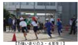
【力強い走りの3・4年生!】