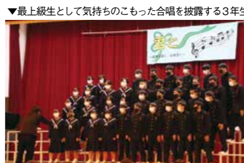
▼最上級生として気持ちのこもった合唱を披露する3年生

11月10日、大任水辺公園にて町職員によるしじみの放流が行われました。大任町しじみ養殖場では、川の自然環境を整えていくことを第一の目的に、以前からしじみの養殖を試みていましたが、今年水質の改善を図り多くの稚貝を確認できた為、初めて彦山川に放流することができました。