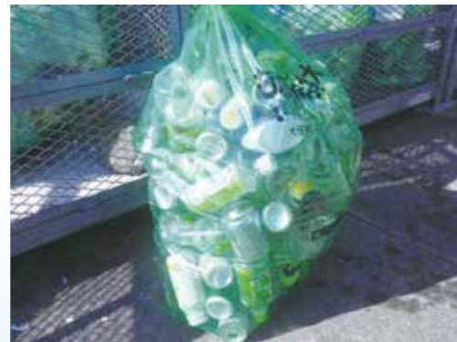
▲可燃ゴミの袋にカンやペットボトルが混じり全く分別がなされていないゴミ。このようなゴミは回収できずにゴミ籠に置れたままになります。