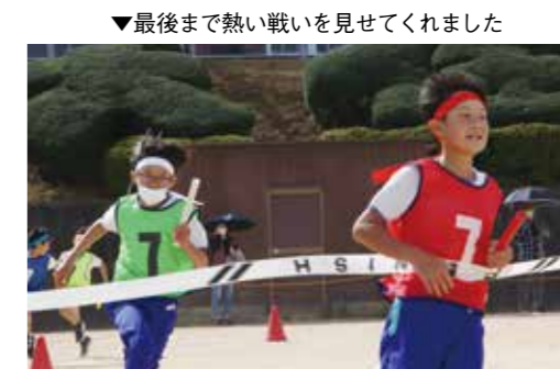
▼最後まで熱い戦いを見せてくれました

10月21日、大任中学校体育館で、秋田雨雀土方与志記念青年劇場による演劇公演がありました。この公演は、文化庁による「文化芸術による子供育成総合事業」の一環として行われました。演劇を鑑賞するだけでなく、生徒たちが演劇の中で実際に舞台上がる場面もあり、とても貴重な体験をしました。