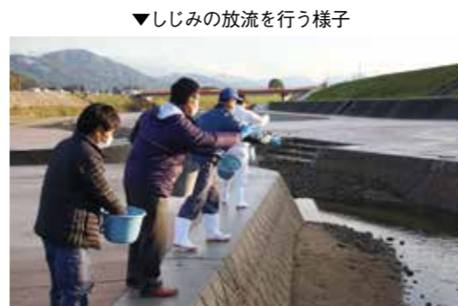
▼しじみの放流を行う様子

11月1日、田川市民会館で、田川地区及び大塚製薬株式会社の包括連携に関する協定締結式が開催されました。この協定は、田川地区8市町村と大塚製薬株式会社、それぞれが持つ「人材」「知識」「サービス」などの資源を活用して協力することにより、田川地区における住民の健康づくり及び住民サービスの向上などを目的としています。