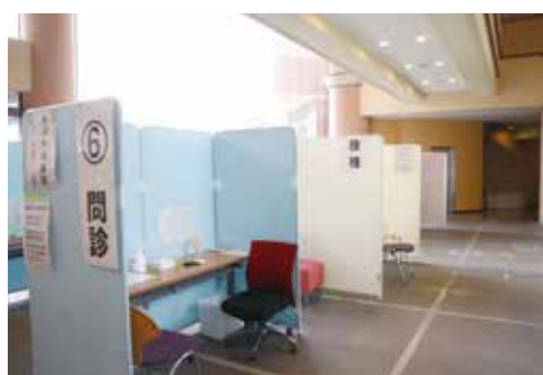
▲役場ロビーに設営された接種ブース