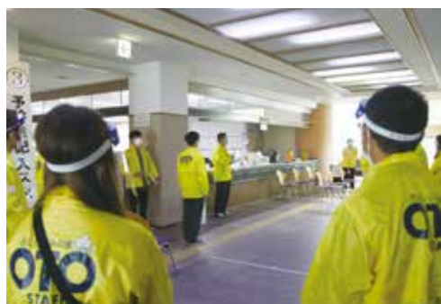
▲入念に集団接種のリハーサルを行う町職員