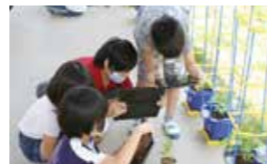
▲アサガオの成長をカメラで記録