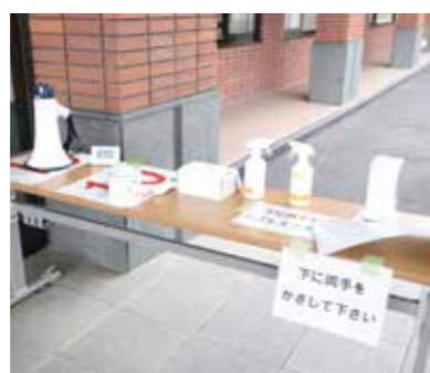
▲受付での感染対策