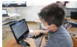
▲正しいフォームってむずかしい

子ども達がタブレットを活用して、必要な情報を自由に取り出しながら、さまざまな方法で意見交流などといった表現活動を行えるようになるでしょう。今後の上達が楽しみです。