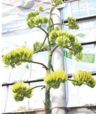
▼高さ4メートルのリュウゼツラン

残念ながら、新型コロナウイルス感染症の影響により、サボテンハウスが閉館中の開花となってしまいましたが、写真でその様子をお届けします。