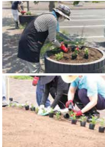
▼職員による花植え

この花植えは、大任町の掲げる「花いっぱいの美しいまちづくり」をさらに推進するため、花のまち推進室が中心となり年2回行われています。今回の花植えでは、マツバボタンと日々草が植えられ、桜街道に彩りを添えました。