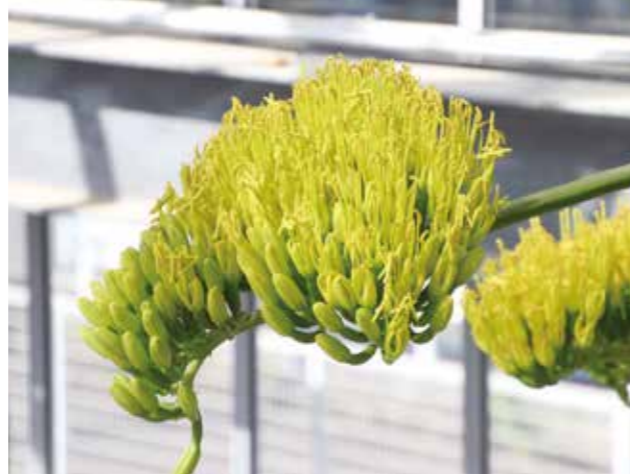
▼鮮やかな黄色の花を咲かせました