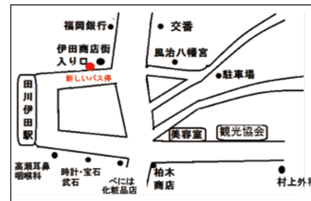
▲伊田駅バス停位置図

田川市が商店街入り口付近に設置した新しいバス停ですので、きれいにお使いください。