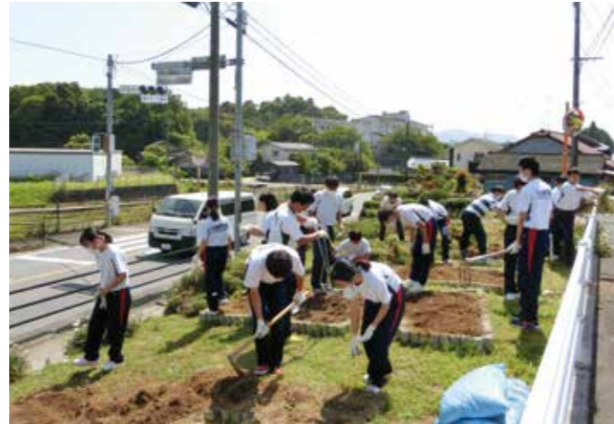
▼協力して作業を進めていました