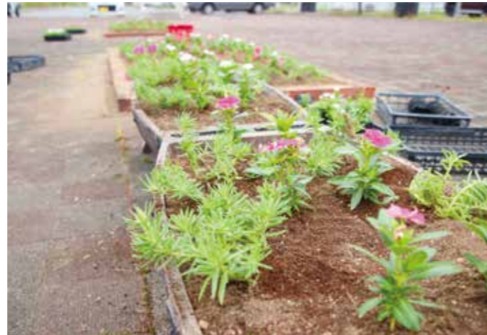
▼上今任公園の花壇