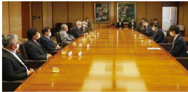
▲服部誠太郎福岡県知事への福岡県町村会会長就任挨拶

本年9月からは、強力な総合調整機能を有するデジタル庁の新設、後期高齢者医療の自己負担割合の見直しなどの制度改革、教育の分野におきましては、デジタル教科書の普及、オンライン学習システムの全国展開等を推進し、今年度から5年