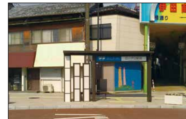
▲新しく設置された商店街入口の伊田駅バス停