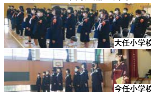
▼まだ、少し大きい中学校の制服が印象的でした

3月18日、大任小学校と今任小学校の卒業証書授与式が行われました。大任小学校31人、今任小学校9人の児童が卒業を迎えました。先生、友達、下級生との記憶を1コマ1コマ振り返り、友との別れを実感。保護者と恩師が見守る中、児童たちは6年間の思い出が残る校舎に別れを告げ、輝く新たな一歩を踏み出しました。