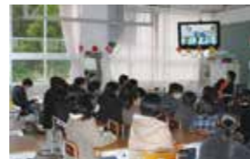
【教室で各学年の発表を視聴】