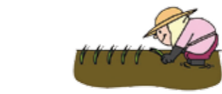
田(水稲)の賃料 ※10aあたり 単位:円