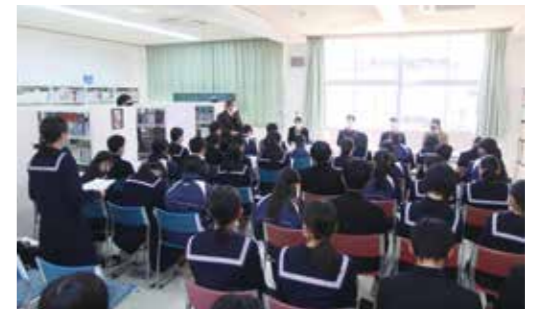
▼美味しい学食について聞き入ってしまいました

2月24日、大任中学校の図書室で1年生の進路学習が行われました。進路学習では、現在高校3年生の大任中学校卒業生4名が講師を務め、在校生からは、高校での部活や校則、勉強の大変さや宿題の量など様々な質問が出されました。講師たちは「大変なことも多いですが、楽しいことも多くあるので、今を頑張ってください」とアドバイスを送りました。