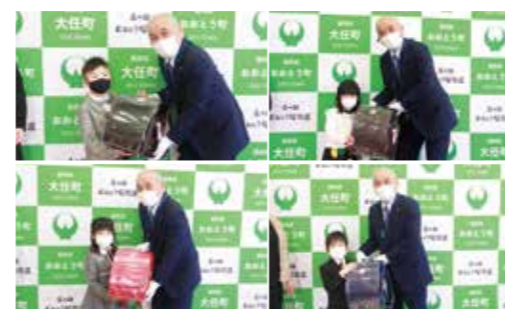
▼緊張しながらも笑顔でランドセルを受け取りました

3月17日、大任町役場でランドセル贈呈式が行われました。このランドセルの贈呈は令和元年度からはじまったランドセル支給事業によるもので、希望のあった家庭に、入学のお祝いとして町よりランドセルを支給しています。ランドセルを受け取った子どもたちは、4月からの新たな環境への期待を胸に、笑顔が咲き誇りました。