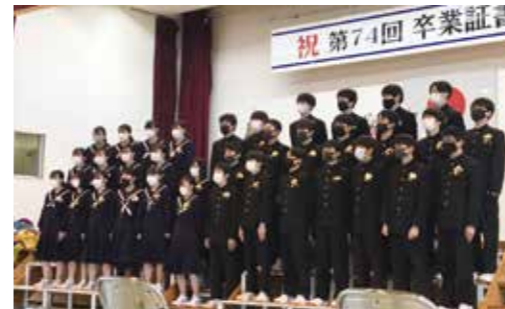
▼3年間の想いを歌にのせ合唱しました

3月12日、大任中学校卒業証書授与式が行われ、38名の生徒が思い出の詰まった校舎に別れを告げました。式では、校長先生による式辞や卒業生からの答辞が述べられ、卒業生たちは思い出を噛みしめながら聞いていました。最後は、先生や保護者に見送られながら、卒業の喜びと中学校生活の思い出を胸に巣立っていきました。