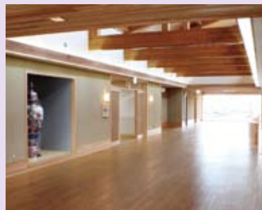
写真上 天然温泉さくら館の浴室につながるエントランスホール 写真下 みなさんの日々の疲れを癒してくれる天然温泉の大浴槽